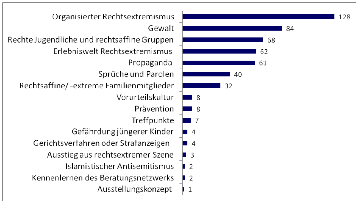
Abb.3: Anlässe für Beratung 2007-2012

Die Wahrnehmung des organisierten Rechtsextremismus ist mit 25% der Nennungen häufigster Grund für die Beratungssuche: Spitzenreiter dabei sind Kameradschaften und Freie Kräfte (28), aber auch die NPD und ihre Jugendorganisation JN (19), sowie die Partei „Die Rechte“ (1 Mal) werden genannt. Beispiele sind etwa die Besorgnis über eine aktive Rolle eines Funktionärs der NPD/JN im Sportverein oder die Kontakte des eigenen Kindes zu einer Kameradschaft. Auch wenn sich Kommunen melden, die immer wieder Veranstaltungsort für Rechtsrock-Konzerte sind, ist dies als Hinweis auf organisierte rechte Strukturen zu werten.