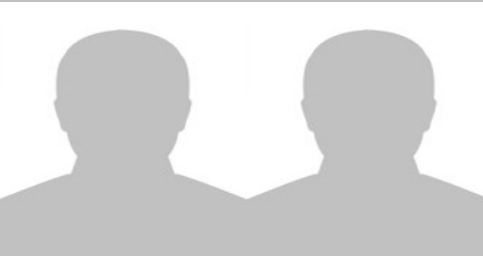
Mahmut Öztürk Student